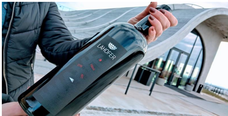
Výrobní řada WAVE / ART