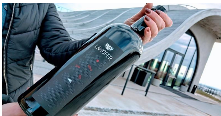
Výrobová řada WAVE / ART