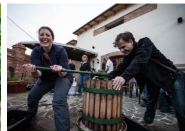
Říjen: sběr hroznů a lisování s rautem a cimbálkou