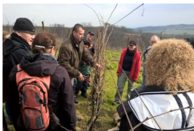
Březen: řez révy a domácí zabijačka