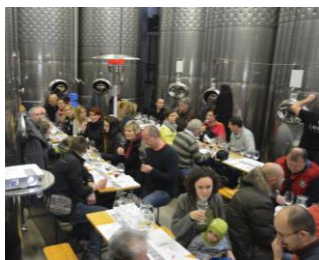
Únor: degustace vín z tanků s rautem a cimbálkou