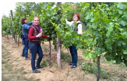
Červen: zelené práce s okopávkou a otevřené sklepy Chvalovice